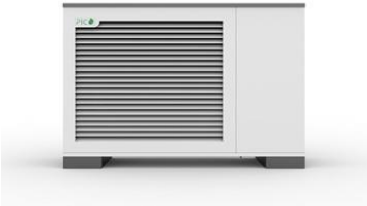
Pico Energy varmepumpe