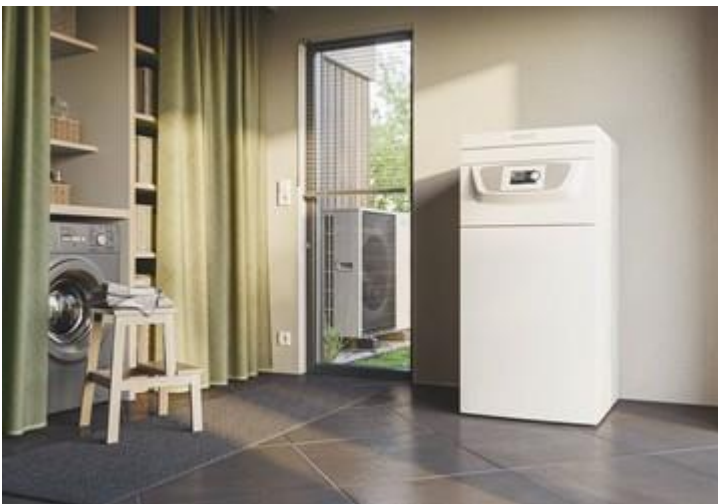
HS Tarm varmepumpe